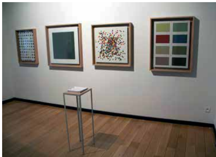
Ief Spincemaille, 'Hacking Velo', 2015. Courtesy de kunstenaar en Galerie Pinsart, Brugge. Prijsindicatie: € 6.750 (het geheel).

Galerie Pinsart Genthof 21 Brugge www.pinsart.be 15-07 t/m 19-08