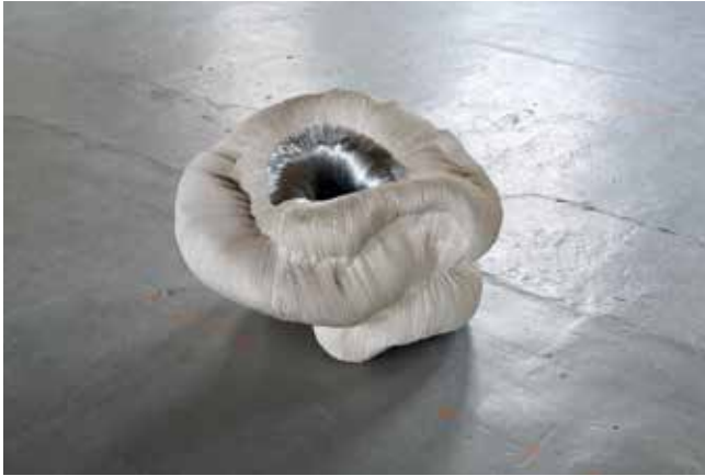
'Origin of light part 6' 2015 70 x 60 x 50 cm aluminium, acryl hars

Iris Bouwmeester (1969) is een Nederlandse abstracte beeldhouwer die opvalt door haar onderzoekende houding en een eigenzinnig materiaalgebruik. Het toeval speelt een sturende rol in haar werkproces waardoor de beelden een onbedacht en ongrijpbaar karakter lijken te hebben.