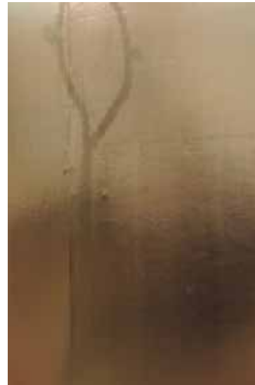
'KIN', 2017 90 x 60 cm foto op goudvinyl en dibond

The reference to the physical can often be found in her photographs and sculptures. As an artist, she enjoys the challenge of putting intimacy and sensuality at the centre of an art that has primarily become conceptual.