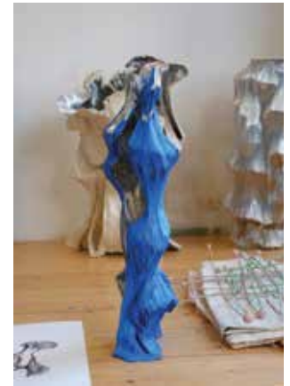
Atelier Iris Bouwmeester Breda, oktober 2017