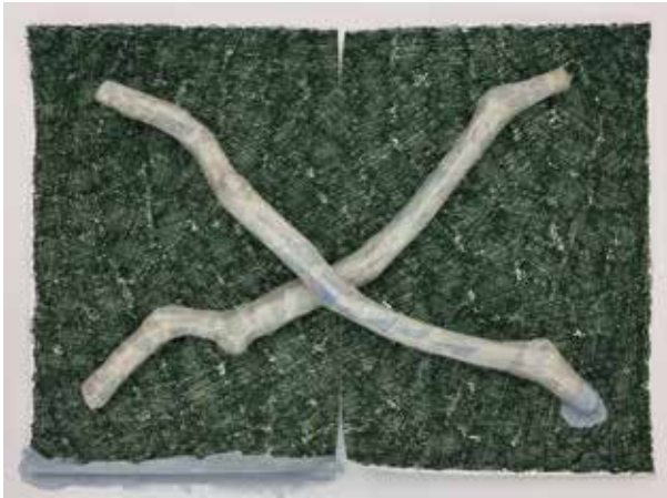
Week 19, 2017 40 x 55 cm archival pigment print

Ze speelt met de conventies van het planmatige en bouwt illusies op om spanning te creëren tussen suggestie en registratie. Ze hecht belang aan het handmatige, de directheid en de inzage van de techniek: niets in haar werk is immers gefotoshopt.