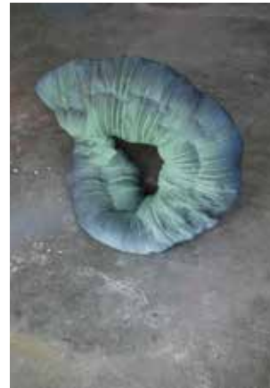
'Green Vortex', 2015 60 x 50 x 25 cm acryl hars, spraypaint

Through the tangible carriers, phenomena such as light, space and volume are also present via the cavities, holes and spaces that tend to encourage the viewer to touch or caress. It seems as if geological processes are becoming visible, balancing between order and chaos, between presence and absence.