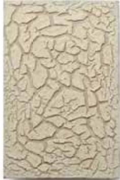
Keramisch wandpaneel, 2018 28 x 18 cm