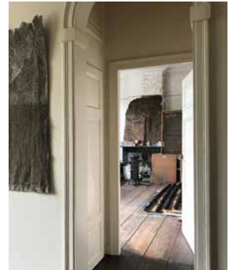
Atelier Paul Bourgeois Wijnegem, 05/2018