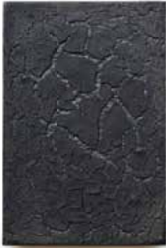
Keramisch wandpaneel, 2018 28 x 18 cm