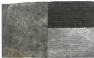
'PB 1058', 2010 14 x 23 cm rubber, stof, lood, geperforeerd

Het worden tweedimensionale en sculpturale volumes waarbij verschuivingen, nuanceringen, verglijdingen minimaal beweging genereren. De poëtische perforaties met een spijker doorheen de oppervlakte gemaakt, lijken een tastbaar verhaal.