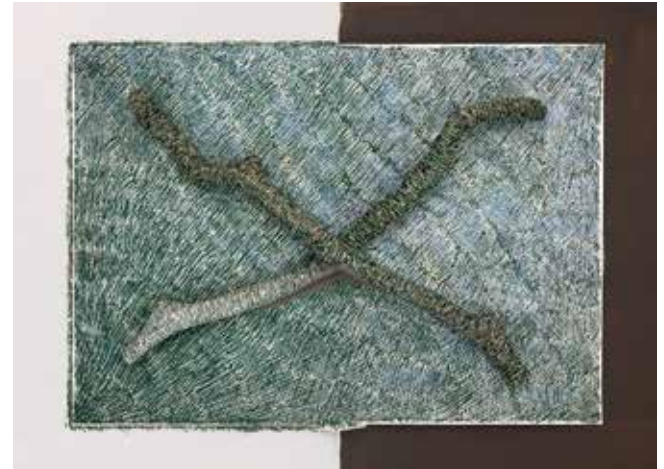
Week 20, 2017 40 x 55 cm archival pigment print

For Ilona Plaum (1970) too, the reference to the tangible is omitted. Her photographs are installations for the flat surface in which perspective becomes the most important subject: she uses surface and depth interchangeably and turns background into an object, the three-dimensional becomes two-dimensional, the distance comes closer.