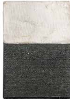
'PB 1248', 2018 27 x 19 cm omslag kunstenaarsagenda, linnen fragment affiche papier, geperforeerd

They metamorphose into two-dimensional and sculptural forms, in which shifts, subtleties and transitions generate minimal movement. The poetic perforations made with a nail through the surfaces, appear to weave a tangible tale.